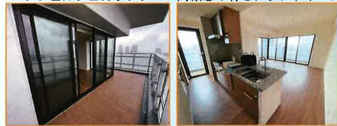
広い2面バルコニー 広々と夜景を見て夕食が出来るリビング