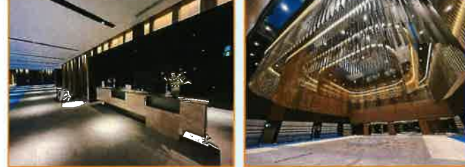
コンシェルジュカウンター 高級感の有るグランドホール