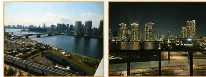
東南角部屋の為、眺望範囲が広く見えます 夜景はエントランスより撮影